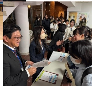
先生からのコメント お渡し♡